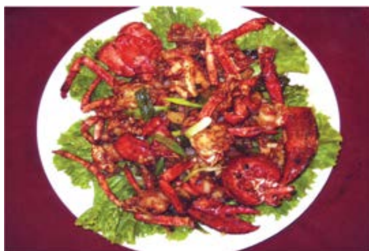
Ginger & Scallion Lobster 火爆薑蔥龍蝦 Tôm Hùm Xào Gừng Hành

Please inform your server of any allergies 請告知您的服務員如果你有任何食物過敏