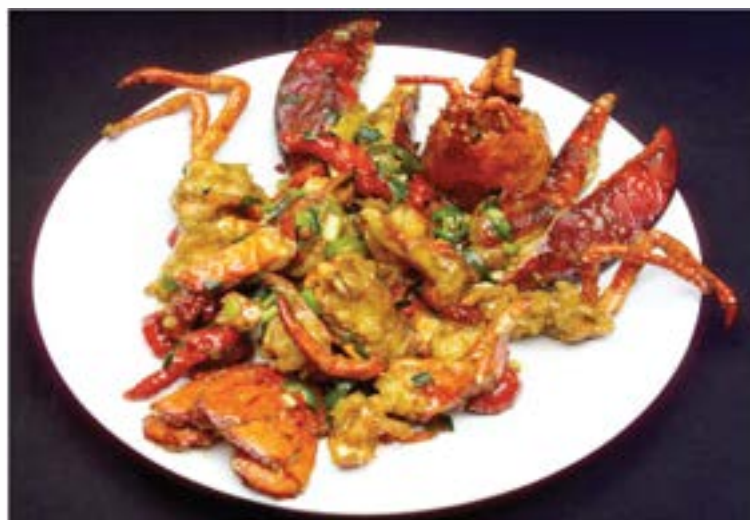
House Special Lobster 招牌龍蝦 Tôm Hùm Xào Đặc Biệt