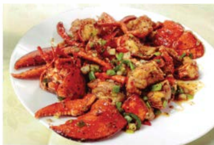
Black Pepper Lobster 黑椒龍蝦 Tôm Hùm Xào Tiêu Đen